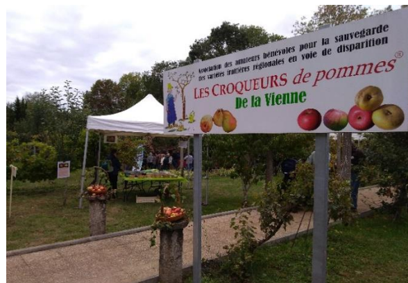
25IEME ANNIVERSAIRE DE L'ASSOCIATION INAUGURATION DU JARDIN DES CROQUEURS