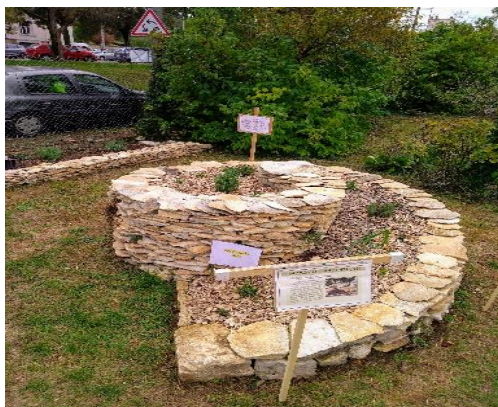
LA SPIRALE A AROMATIQUE